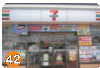
42 セブンイレブン矢板下太田店 (下太田)