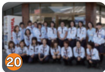
20 ヤクルト矢板センター (本町)