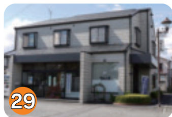
29 木村屋 (片岡)