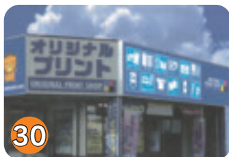
30 オリジナルプリントショップ (末広町)