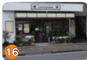
16 ツーリングショップ (扇町)