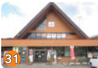
31 JAしおのや片岡支店 (片岡)