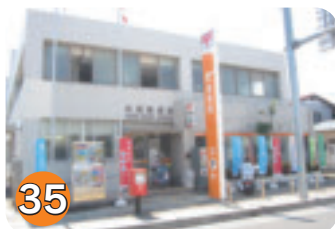
35 矢板郵便局 (扇町)