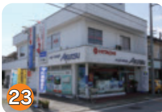
23 アクツ電器 (本町)