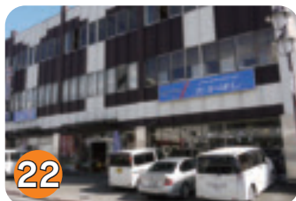
22 たかはし (高橋金物店) (扇町)