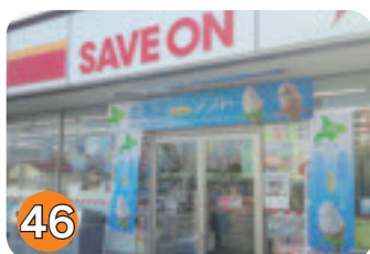
46 セーブオン矢板鹿島店 (鹿島町)