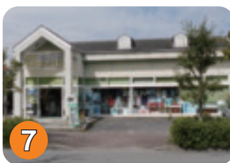
7 ボナンザ (末広町)