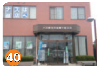
40 大田原信用金庫矢板支店 (木幡)