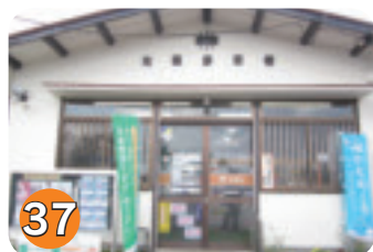
37 片岡郵便局 (片岡)