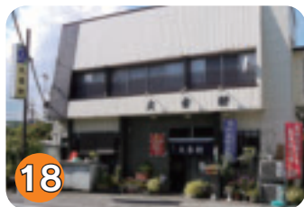
18 大章軒 (扇町)