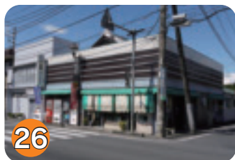
26 江部商店 (片岡)