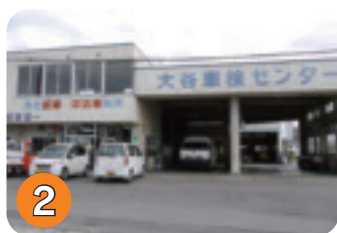
2 大谷自動車修理工場 (扇町)