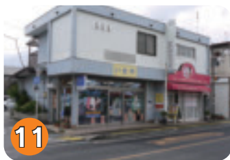
11 いせや化粧品店 (扇町)