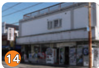
14 新川屋酒店 (扇町)