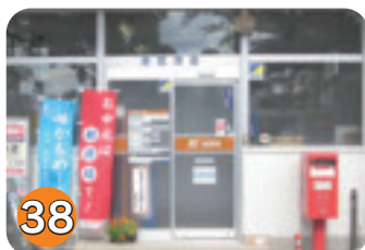
38 泉郵便局 (泉)