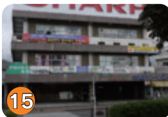
15 矢板ツーリング (扇町)