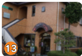
13 ヤマト美容室 (扇町)