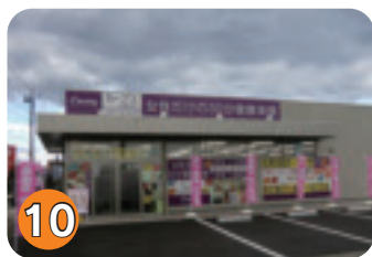
10 カープス矢板末広 (末広町)