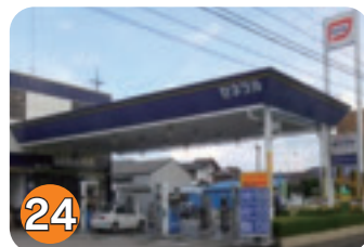
24 ヤマグチ (鹿島町)