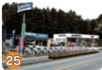
25 飯村自動車商会 (片岡)