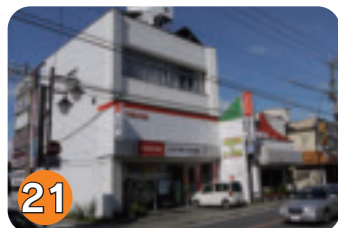
21 江戸屋電機 (エドヤデンキ) (扇町)