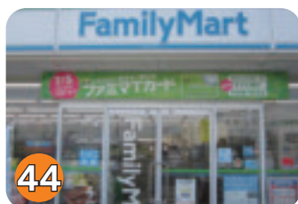
44 ファミリーマート矢板北店 (矢板)