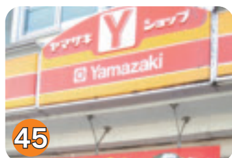
45 Yショップ (扇町)