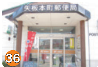
36 矢板本町郵便局 (本町)