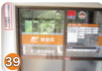
39 安沢簡易郵便局 (安沢)