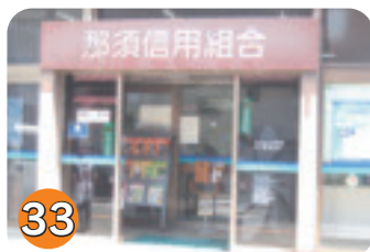
33 那須信用組合矢板支店 (本町)