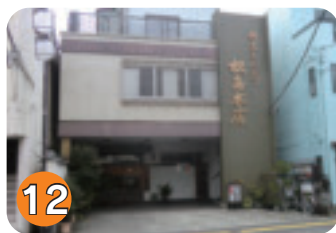
12 松島本店:とんかつ松島 (扇町)