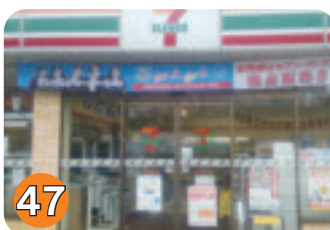
47 セブンイレブン矢板中店 (中)