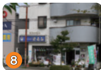
8 スタジオさとう (末広町)