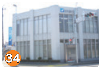
34 足利銀行矢板支店 (扇町)