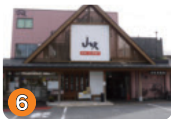
6 ビックミート山久 (末広町)