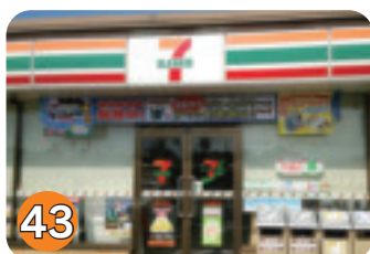
43 セブンイレブン矢板富田店 (富田)