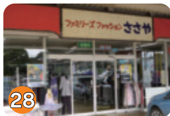
28 ささや (片岡)