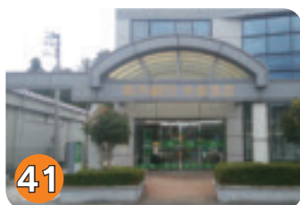
41 栃木銀行矢板支店 (鹿島町)