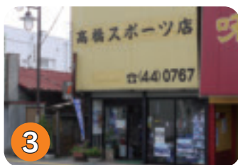
3 高橋スポーツ店 (扇町)