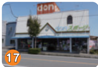
17 DONスポーツ (鹿島町)