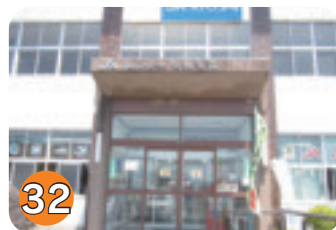
32 JAしおのや矢板支店 (本町)