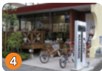
4 T・カフェ長峰 (扇町)