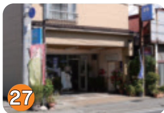
27 ビューティショップたなか (片岡)