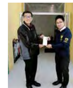
家族葬専用式場つむぎ矢板