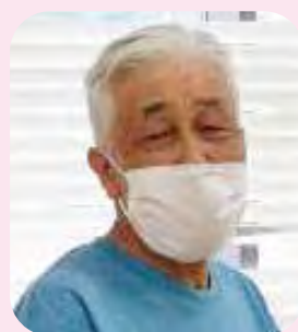
創年大学ぶらぶらクラブ所属 (ボランティア団体)