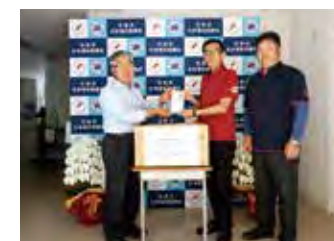
連合栃木那須地域協議会