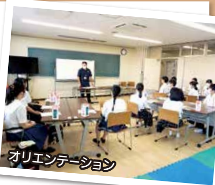
オリエンテーション

これまで高校生を対象に開催しておりましたボランティアサマースクールですが、今年度から中学生も対象に実施し、26名の皆さんが参加されました。オリエンテーションでの災害ボランティア活動についての話から始まり、ボランティア活動体験では、給食ボランティアやイクボス池田キッズハウスでの交流、小学生と一緒に赤い羽根共同募金箱づくり等に取り組み、思いやりの心を育みました。