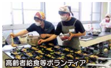
高齢者給食等ボランティア