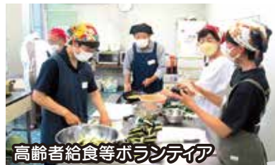
高齢者給食等ボランティア