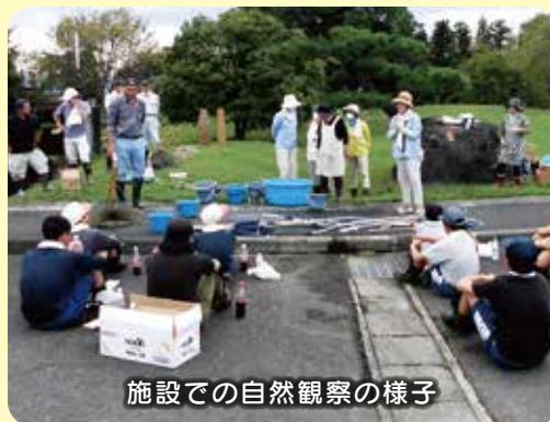
施設での自然観察の様子