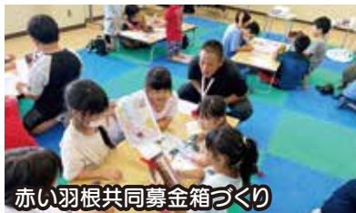
赤い羽根共同募金箱づくり