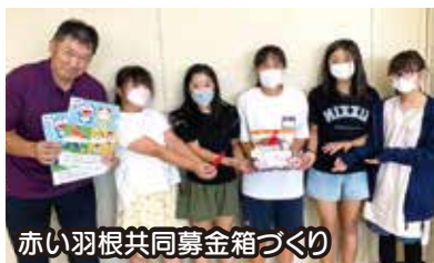
赤い羽根共同募金箱づくり