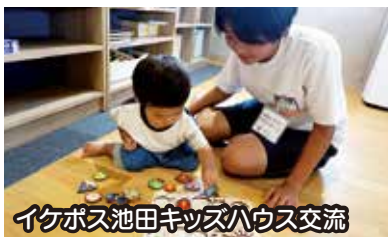
イクボス池田キッズハウス交流