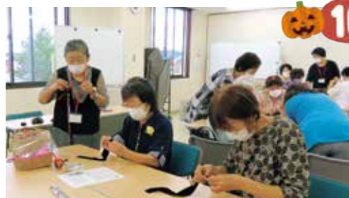
バラのコサージュづくり