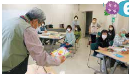
和紙で楽しむステンドグラスづくり

ボランティアの出番・役割づくり、参加者の趣味と仲間づくりを目的に、居場所のひとつとして開催しています。