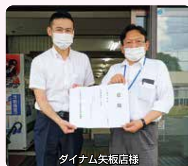
ダイナム矢板店様