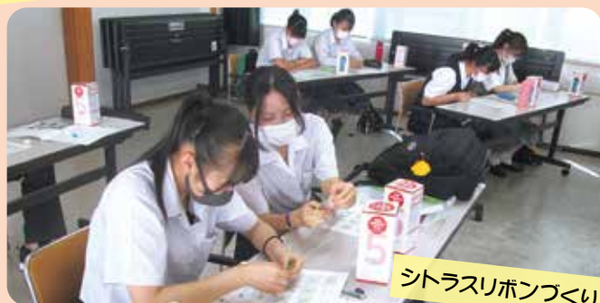
シトラスリボンづくり

発行 社会福祉法人 矢板市社会福祉協議会 編集 社協だより編集委員 矢板市扇町二丁目4番19号 TEL 0287-44-3000 印刷 株式会社 幕 巻