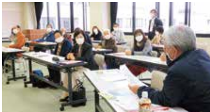
矢板 助け合いの会「やさしい手」

高齢になっても住み慣れた地域で自分らしく暮らすためには、住民同士の助け合い・支え合いがとても大切です。第2層協議体では、地域で行なわれている助け合い活動や「こんな手助けがあったらいいな」と思うことなどの情報交換・話し合いを行っています。