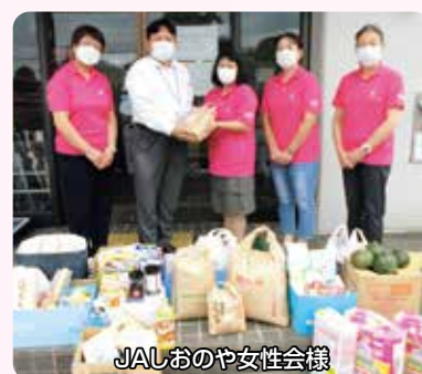
JAしおのや女性会様