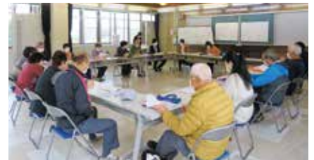
片岡 ささえあいの会